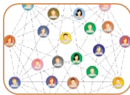
Nya kontakter och matchmaking