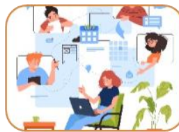
Forum för att testa och kunskapsdela

AI Arena har arrangerat webinarier, konferenser, hackathon, AI-mingel och podcast. En genomförandegrupp med tema AI och digitala tvillingar har startat upp med deltagare från offentliga och privata aktörer och akademien. På hemsidan aiarena.se finns kalendarium och evenemang.