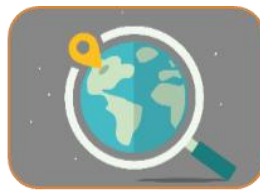
Omvärldsspaning och goda exempel