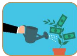
Möjligheter att skapa finansiering