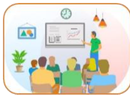
Kompetenshöjning och inspiration

AI Arena bidrar genom sina evenemang följande nyttor till deltagarna: