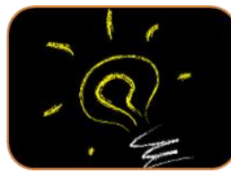
Hjälp att identifiera behov och möjligheter